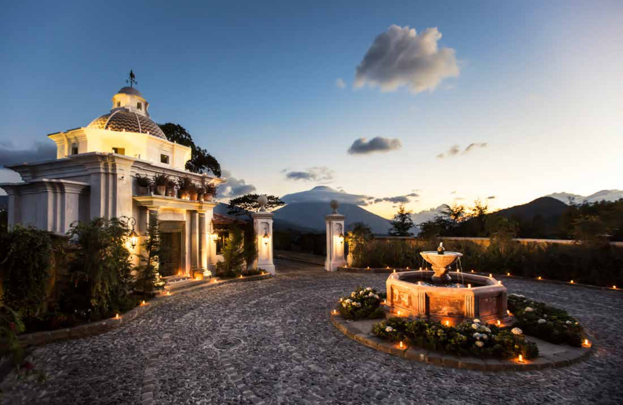
Foto Garita Norte y Volcanes